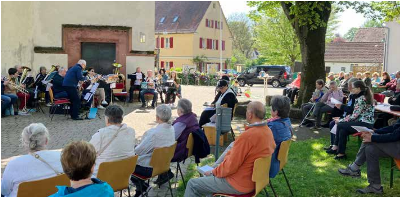
Der gemeinsame Gottesdienst zu Himmelfahrt findet wieder „unter den Linden“ in Schalkhausen statt, wie hier 2024

Bei schlechtem Wetter findet der Gottesdienst in der Kirche St. Nikolaus statt.