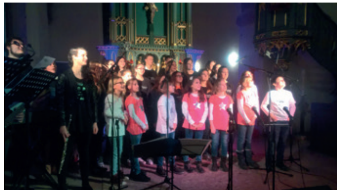
Soulteens Ansbach und Soulchildren

Wir freuen uns über Kinder und Jugendliche, die bei uns mitsingen möchten. Wir proben immer am Donnerstag im Gemeindehaus Hennenbach, Martin-Leder-Straße 1: