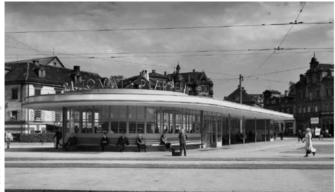
„Europas erstes Automatenrestaurant“ am Nürnberger Plärrer, 1933