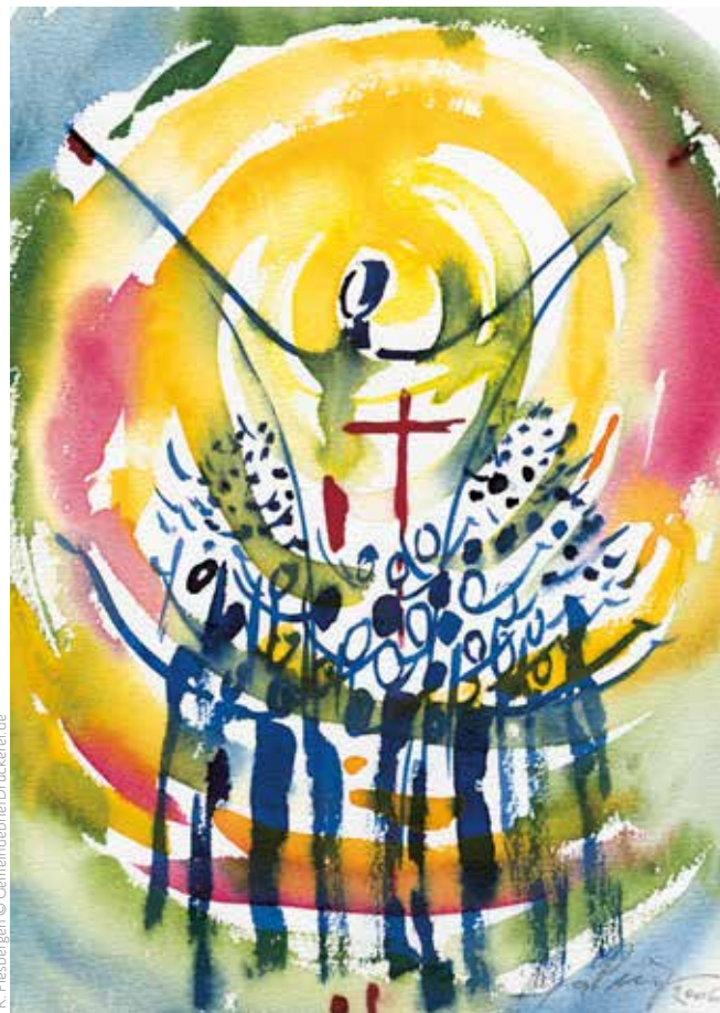
R. Priesbergen © Gemeindebücherei/Druckerei.de

Für Menschen, die nicht in die Kirche kommen können, bieten wir die ganze Woche das Abendmahl zu Hause an. Rufen Sie im Pfarramt (Telefon 0981 61996) an und vereinbaren Sie einen Besuch.