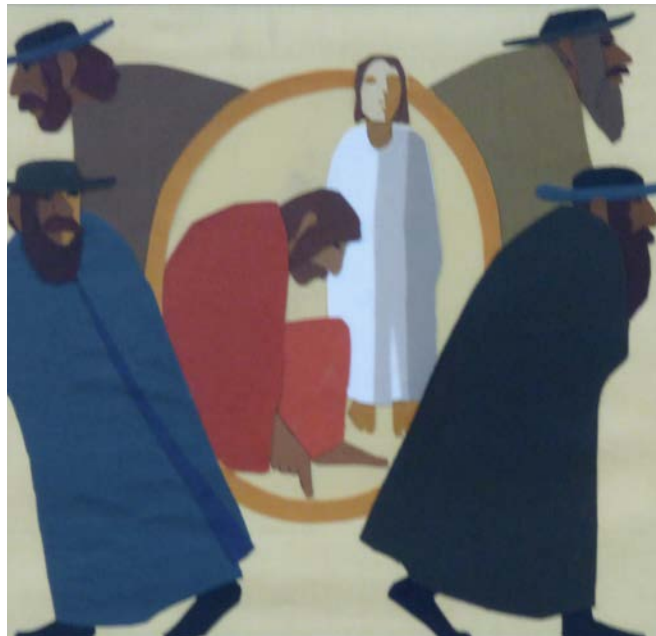
Jesus und die Ehebrecherin