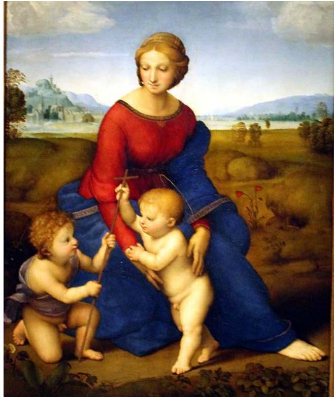
„Madonna im Grünen“ mit den Kindern Jesus und Johannes (Raffael, 1506)

sie werde von Gott ein Kind empfangen. Dieses Ereignis wird heute unter der Bezeichnung „Verkündigung des Herrn“ am 25. März gefeiert. Drei Monate später wird Johannes am 24. Juni geboren, der am 25. März gezeugte Jesus weitere sechs Monate später am 25. Dezember.