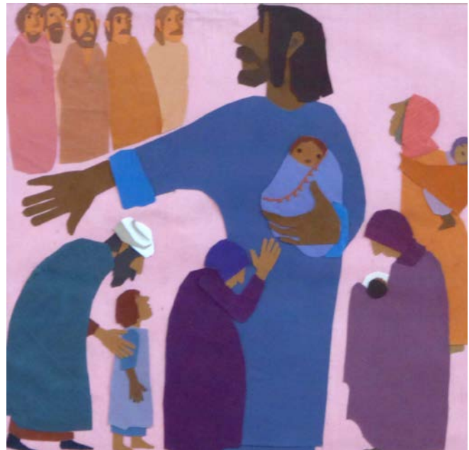
Sie brachten Kinder zu ihm

Begeben Sie sich mit uns auf eine Entdeckungsreise und lernen Sie neue, unbekannte Geschichten und altbekannte Geschichten neu kennen!