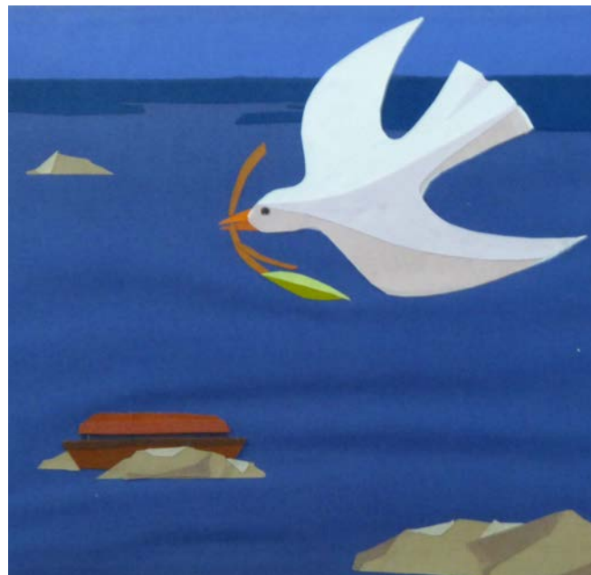
Ende der Sintflut

Der etwas andere Gottesdienst 13. Juni 2021, 10.30 Uhr