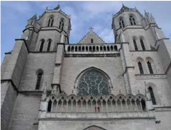
Kathedrale Saint-Bénigne in Dijon

Auf Ihr Kommen freut sich das Team des Seniorentreffs