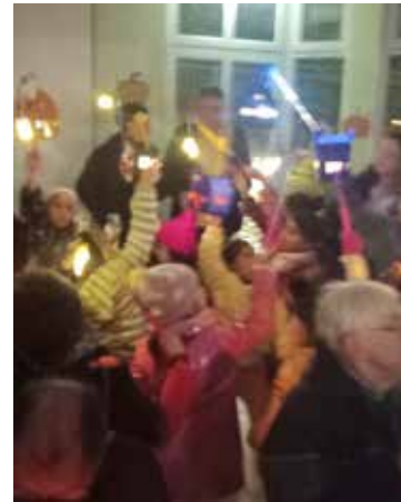
Mit selbstgebastelten Laternen (Bild oben) besuchten die Kinder das Seniorenheim Haus an der Ludwigshöhe